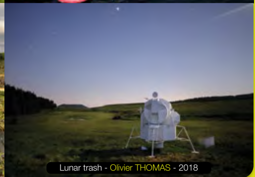
Lunar trash - Olivier THOMAS - 2018