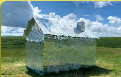
La cabane aux miroirs - Antoine JANOT - 2023