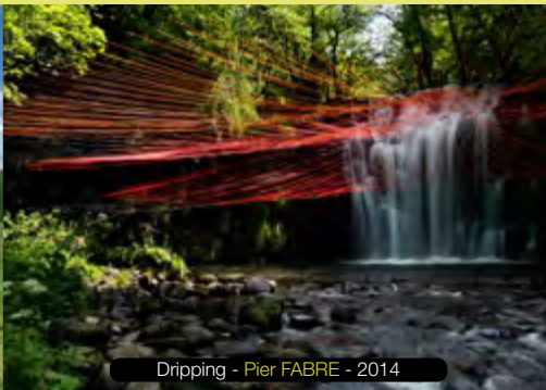
Dripping - Pier FABRE - 2014