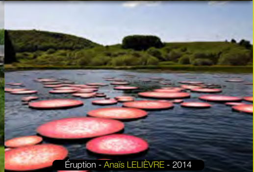
Éruption - Anaïs LELIÈVRE - 2014