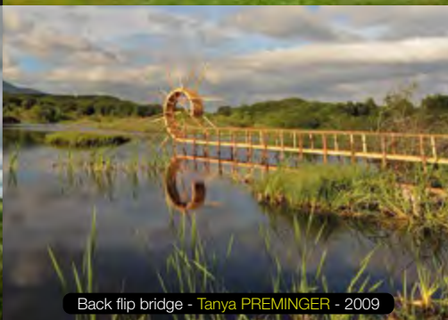
Back flip bridge - Tanya PREMINGER - 2009