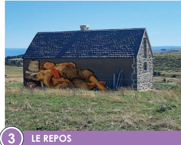
3 LE REPOS Longueur : 3,5 m / Hauteur : 1,6 m Bois, papier recyclé, vernis écologique

L'installation Le Repos se présente comme une apparition inattendue, celle d'un géant allongé contre le buron, oscillant entre rêve et réalité. L'artiste met en scène un jeune buronnier, inspiré d'une peinture d'Amalia Lindgren, artiste suédoise du XIX e siècle, représenté à une échelle monumentale. Allongé après une journée de travail, la tête posée sur un tabouret de traite où repose un seau à lait, il apparaît comme un géant endormi veillant sur la montagne. Cette figure incarne la mémoire des buronniers, rend hommage à la rudesse de leur labeur et souligne le rôle protecteur du buron dans le paysage du Sancy. Sa présence, à la fois humble et imposante, transforme l'architecture en refuge bienveillant et réactive la mémoire du lieu. Le spectateur est invité à percevoir le paysage à travers le regard de cette figure endormie, à ressentir la vie et le travail qui l'ont façonné.