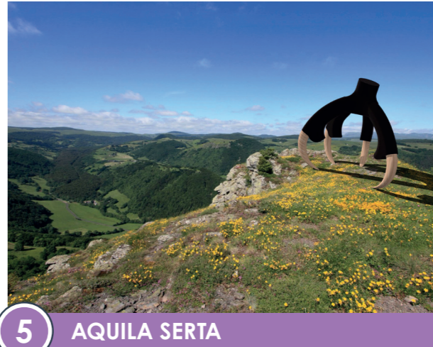
5 AQUILA SERTA Hauteur : 3,6 m / Longueur : 4,4 m / Largeur : 3,5 m Bois et liège noir

Aquila Sert est une œuvre monumentale : au centre de cette immense serre de rapace, l'humain paraît tout petit. Avec cette serre, l'artiste symbolise la présence et l'importance des rapaces dans le massif du Sancy. L'œuvre exprime aussi la volonté de mettre au premier plan le vivant, à travers les matériaux que l'artiste affectionne : le liège et le bois massif. Elle permet de créer des expériences de nature singulières avec du vivant inaccessible et passionnant.